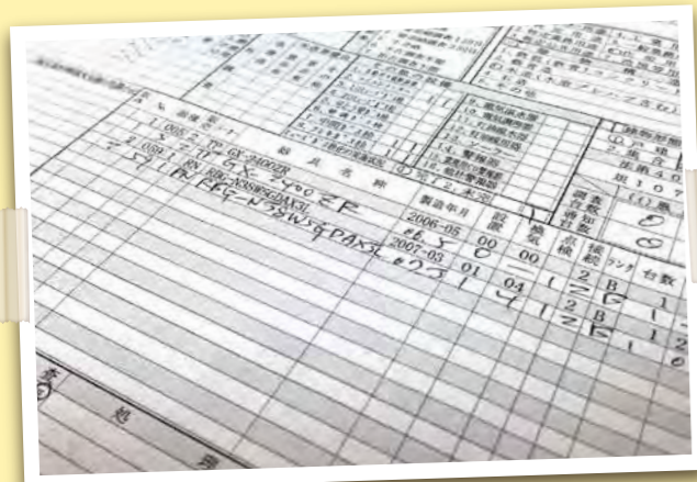
※画像は、都市ガスのものです。

ガス設備安全点検の検査項目と結果を記録する「需要家先保安台帳」には、お客様がお持ちのガス機器の名称(型式)、製造年月、設置状況なども記録いたします。この情報は、ガスメーター設定の参考にするほか、ガス機器の修理のご連絡を頂戴した場合などにスムーズにご対応するための情報として有効に利用させていただいております。