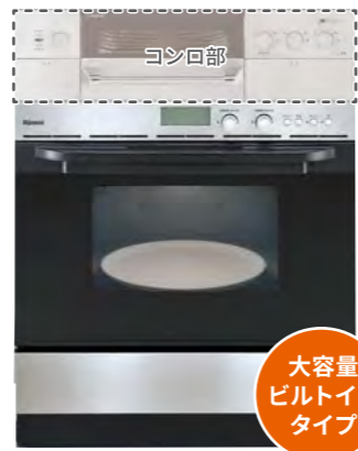
大容量ビルトインタイプ

電子レンジとガス高速オーブンが一台になった電子コンベック。電子が料理の内側から、ガスが外側からこんがり焼き上げます。火の通りにくい肉料理なども素材の中まで、ムラなく加熱してスピーディに仕上げます。