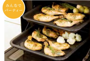
みんなでパーティー

卓上タイプをはじめ、キッチン組み込み型のビルトインタイプもラインナップ、ビルトインには大容量44ℓの<ビッグ>タイプも。