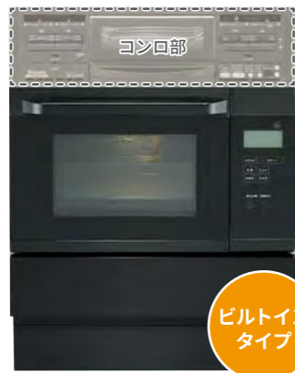
ビルトインタイプ