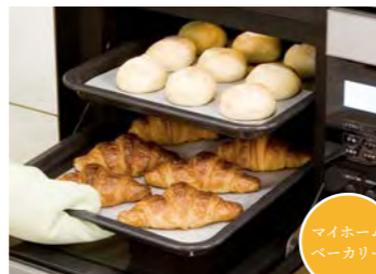
マイホームベーカー