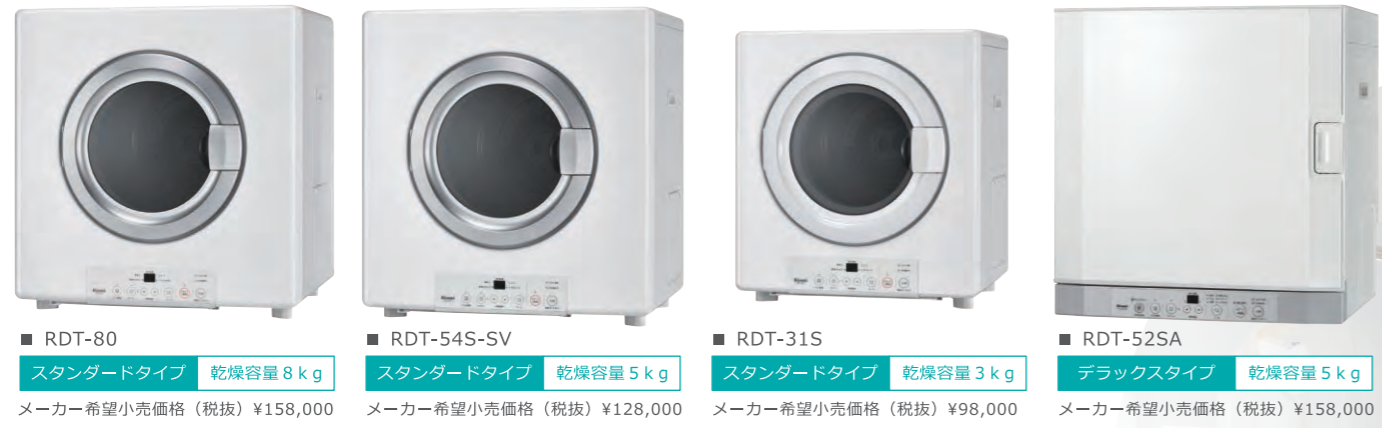
■ RDT-80 スタンダードタイプ 乾燥容量 8kg メーカー希望小売価格(税抜) ¥158,000 ■ RDT-54S-SV スタンダードタイプ 乾燥容量 5kg メーカー希望小売価格(税抜) ¥128,000 ■ RDT-31S スタンダードタイプ 乾燥容量 3kg メーカー希望小売価格(税抜) ¥98,000 ■ RDT-52SA デラックスタイプ 乾燥容量 5kg メーカー希望小売価格(税抜) ¥158,000