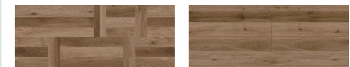
【ドア】室内引戸Vレール方式 デザイン: LAH / ボトルグリーン 【床材】パーケット調ナチュラルオークF・ナチュラルオークF

さわやかな空気感あふれるコーディネートアクセントになっているのはボトルグリーンの引戸と、メリハリをつける室内用窓。懐かしさと機能美が同居する空間です。