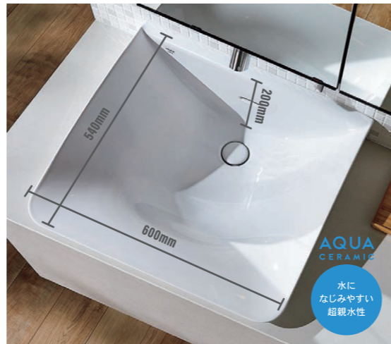
水になじみやすい 超親水性

水栓まわりは、拭き掃除の手間がほとんどありません。しかも、水栓とミラーが一体化になったデザインで、ボウルまわりがすっきり。下部照明を組み合わせて上質な空間演出もできます。セラミックカウンターは、焼きものならではの繊細な表情で洗面空間を引き立て、汚れはもちろん、キズに強く、美しさを保てます。化粧水やファンデーションなど染み込みにくく、軽く拭くだけでお手入れできます。表面硬度は高く、はさみなどを置いてもキズが付きにくくなっています。熱による変色や変形もなく、アイロンの作業台やドライヤー置き場としても安心してお使いいただけます。バックパネルは、空間を個性的に彩るモザイクタイル2色をご用意、そのほか、カウンターのカラーに合わせた2色、木目調3色からお好みのパネルカラーをお選びいただけます。