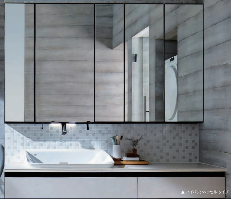
▲ハイバックベッセルタイプ

一人ひとりの“豊かさ”の概念は違う。だからこそルミスは、使いやすさというクオリティも、これまでと違う新しい領域にまで踏み込んでいく。もっと優雅でありたい、もっと自分らしくありたい、そして、もっと使いやすく。そのために3つのルミスには、デザイン、ディティール、素材、テクノロジーを注ぎ込んでいく。