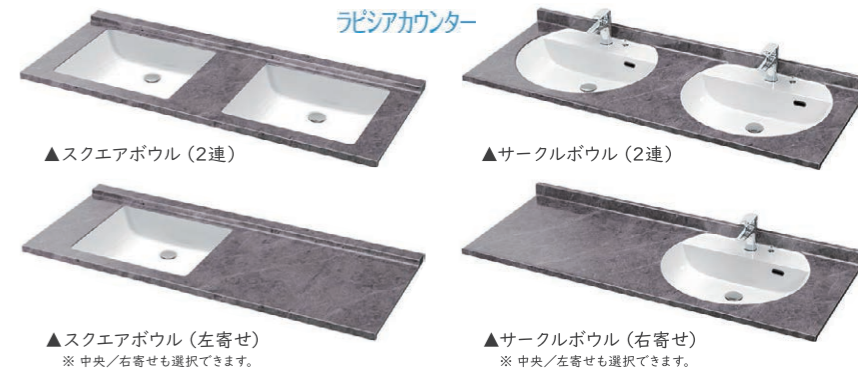
▲スクエアボウル（2連）