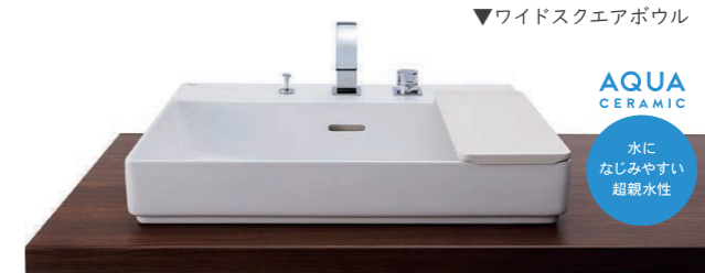
水になじみやすい 超親水性

洗練されたインテリアに似合うルミス「ベッセル」タイプ。陶器ボウルと木目の組み合わせは、コントラストが効いた家具のよう。陶器ならではの美しい質感は、モダンな空間に調和しやすく、お好みのインテリアに合わせたい方に。「ワイドスクエアボウル」は、シャープなエッジ、洗練されたデザインながら安心感のある使いやすい前幅650mm。そのほかにも、コンパクト＆シンプルな「スクエアボウル」と「オーバルボウル」もラインナップ。この「ベッセル」タイプでは、ミラーもキャビネットもカウンターも壁から壁へピッタリのオーダーが可能。造りつけの家具のように壁から壁へぴったり納まるサイズ対応力。扉の開閉音や収納部も品位にこだわって仕上げています。